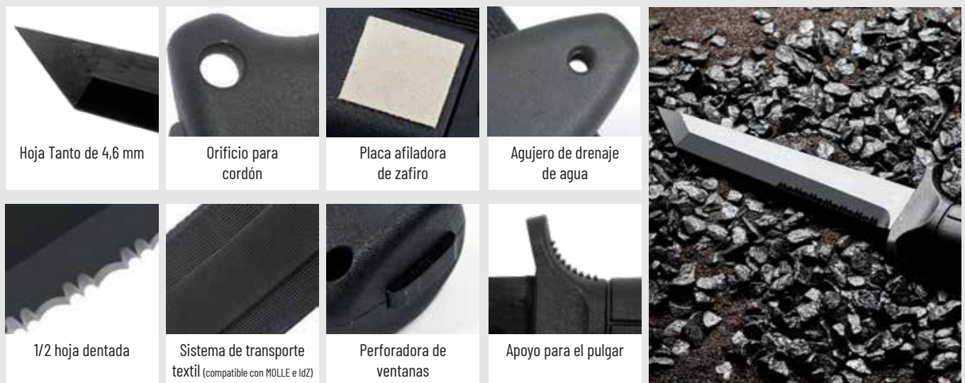
Hoja Tanto de 4,6 mm