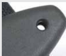
Trou de drainage de l'eau