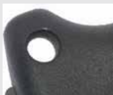
Trou pour lanière