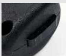
Perforateur de fenêtre