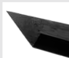
Lame Tanto solide de 4,6 mm