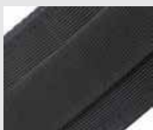
Système de portage en textile (compatible avec MOLLE et I&Z)