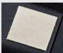
Plaque d'affûtage en saphir