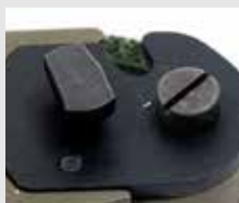
Boulon d'arrêt du coupe-fil