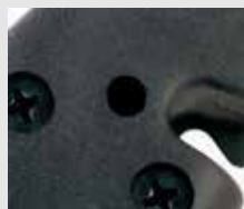
Trou de drainage de l'eau