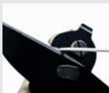
Coupe-fil ultra résistant