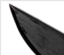
Fuerte hoja Bowie de 3,6 mm