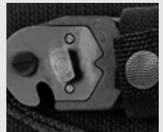
Cortador de alambre perno de parada