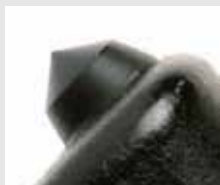
Perforadora de ventanas