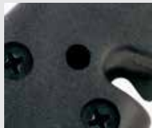
Agujero de drenaje de agua