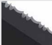
1/2 hoja dentada