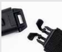
Opción: textil „cierre rápido“