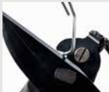
Coupe-fil ultra résistant