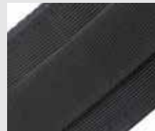
Système de portage en textile (compatible avec MOLLE et I&Z)