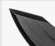
Lame de bowie de 3,6 mm solide