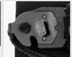
Boulon de récupération des cisailles à fil